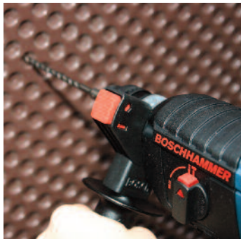
Percer Ø 6 mm