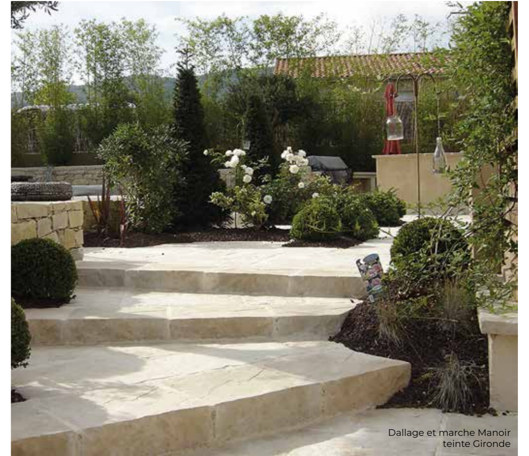
Dallage et marche Manoir teinte Gironde