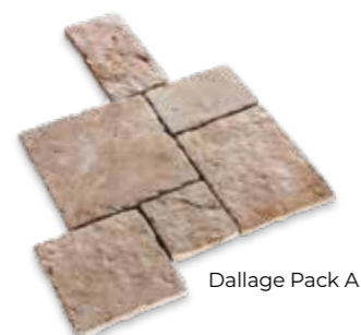
Dallage Pack A

Pack A 6 formats ép. 4 cm NF 30x30-45x30-45x45-60x45-60x30-60x60 cm 6,075m 2 /palette