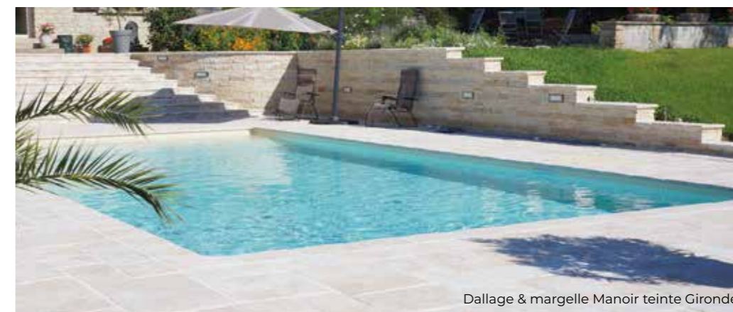
Dallage &amp; margelle Manoir teinte Gironde

PROTECTION & NETTOYAGE des dallages : il est recommandé de protéger vos surfaces. Retrouvez nos conseils en fin de catalogue.