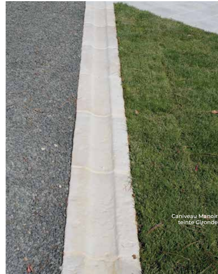
Caniveau Manoir teinte Gironde

Caniveau droit : 60 x 30 cm ép. 5 cm 21 u/palette