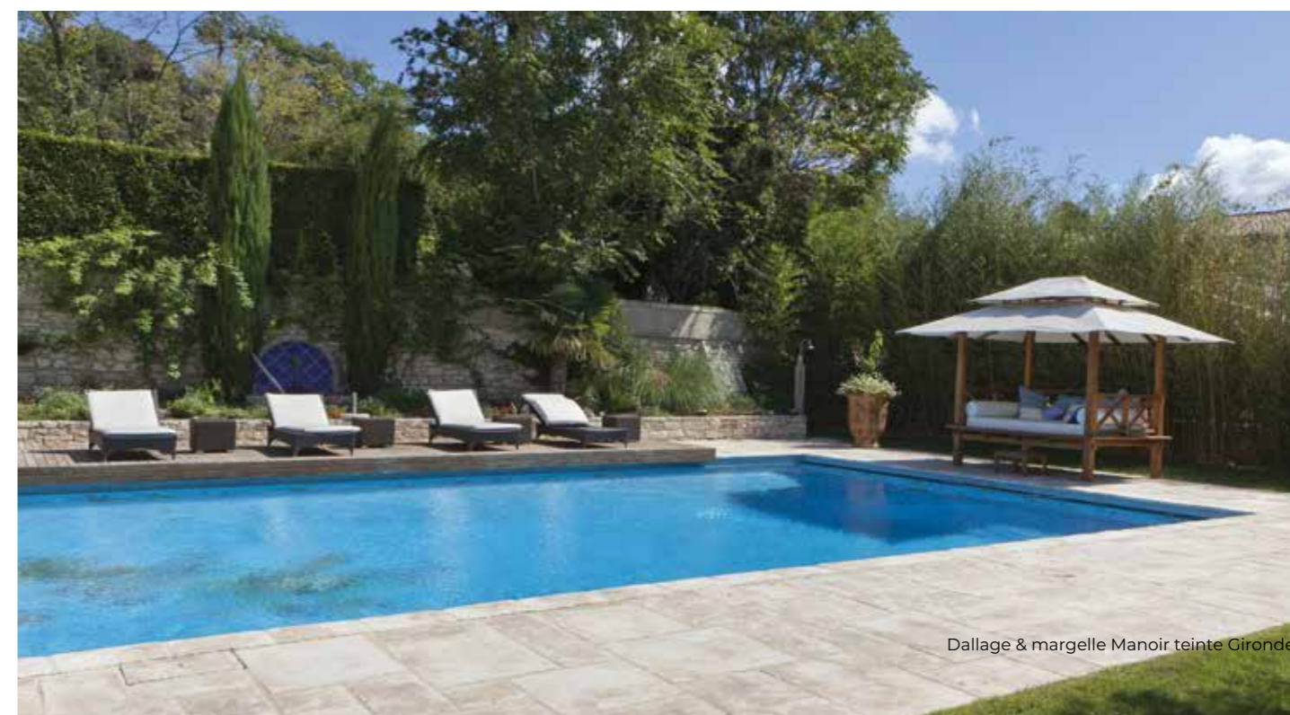
Dallage &amp; margelle Manoir teinte Gironde

Angle externe 90° NF 30 x 30 cm - 24 u/palette