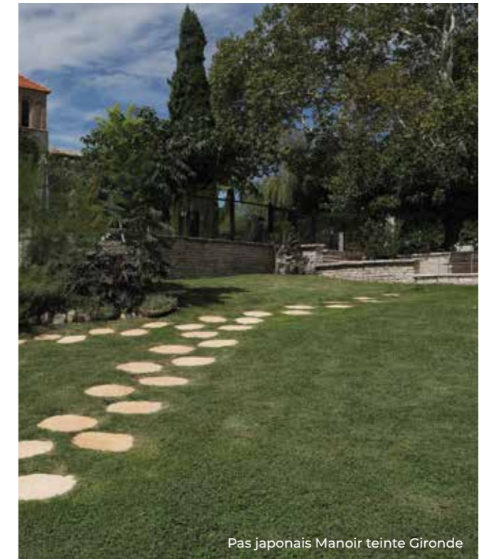
Pas japonais Manoir teinte Gironde