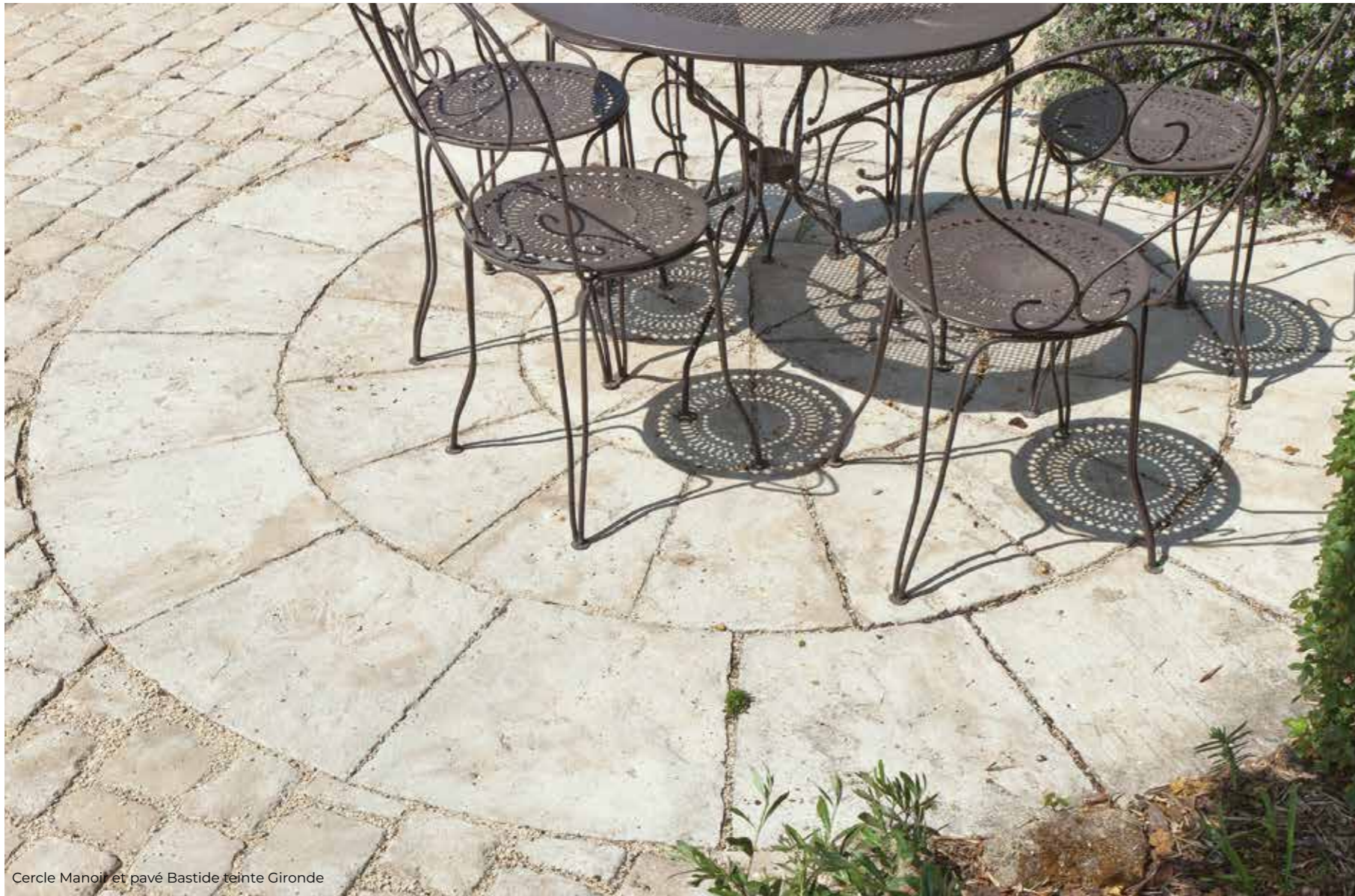
Cercle Manoir et pavé Bastide teinte Gironde