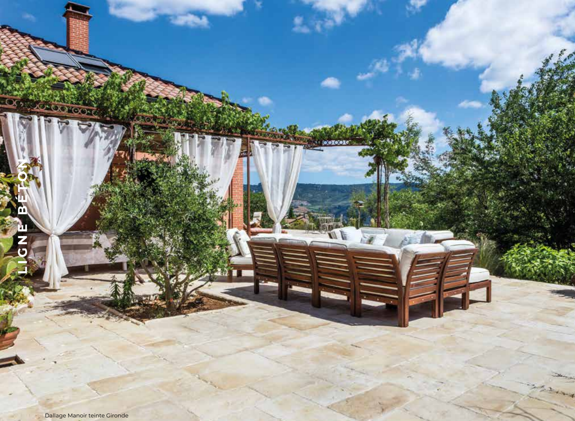
Dallage Manoir teinte Gironde