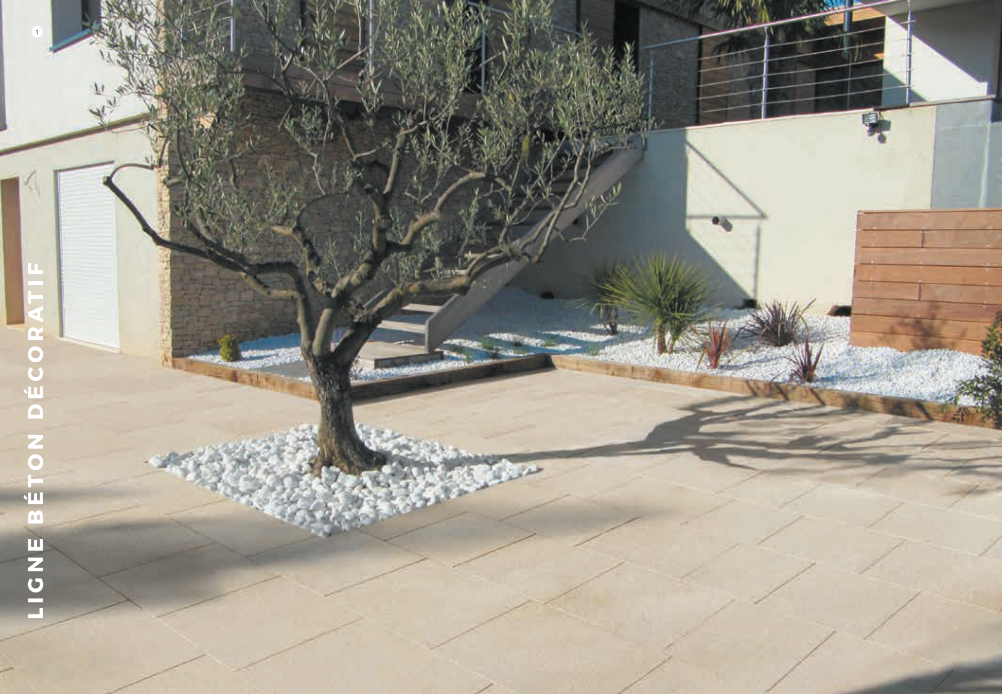
Dalle Calanco/Horizon, 1 2 teinte Pierre

→ Pour plus de détails, voir le cahier technique p.132