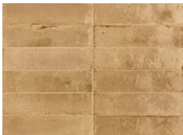
R8FP 6x24 Beige