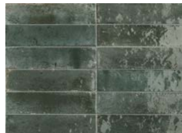
R8FQ 6x24 Avio