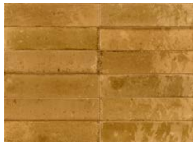
R8FT 6x24 Ocra