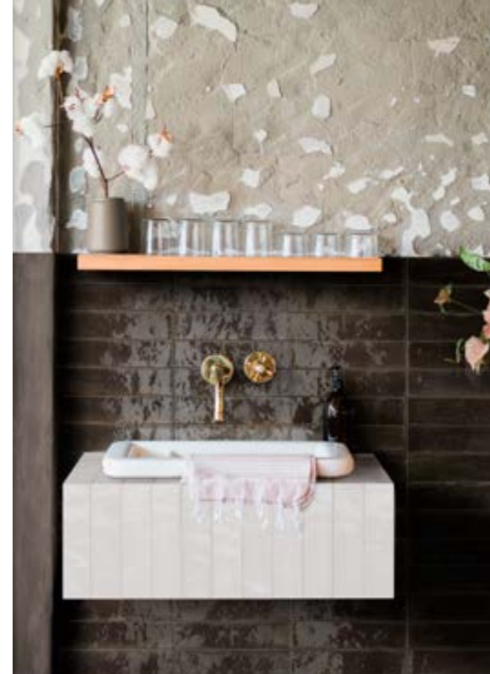
R8FM Look Bianco 6x24 - 2 3/8 x 9 7/16 - R8FN Look Nero 6x24 - 2 3/8 x 9 7/16