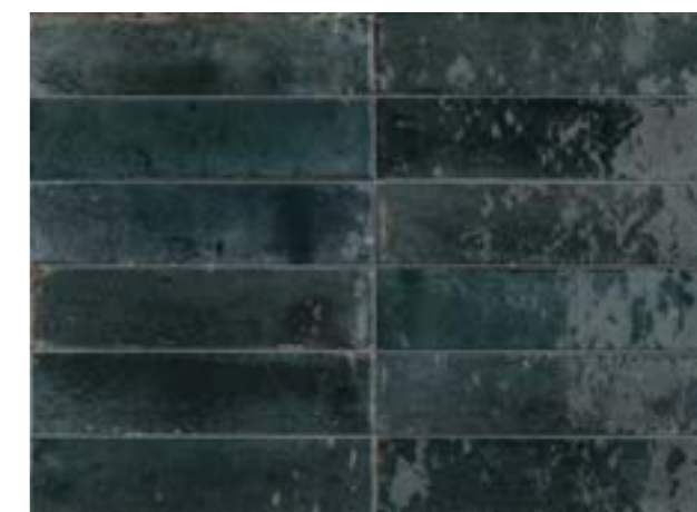
R8FR 6x24 Blu