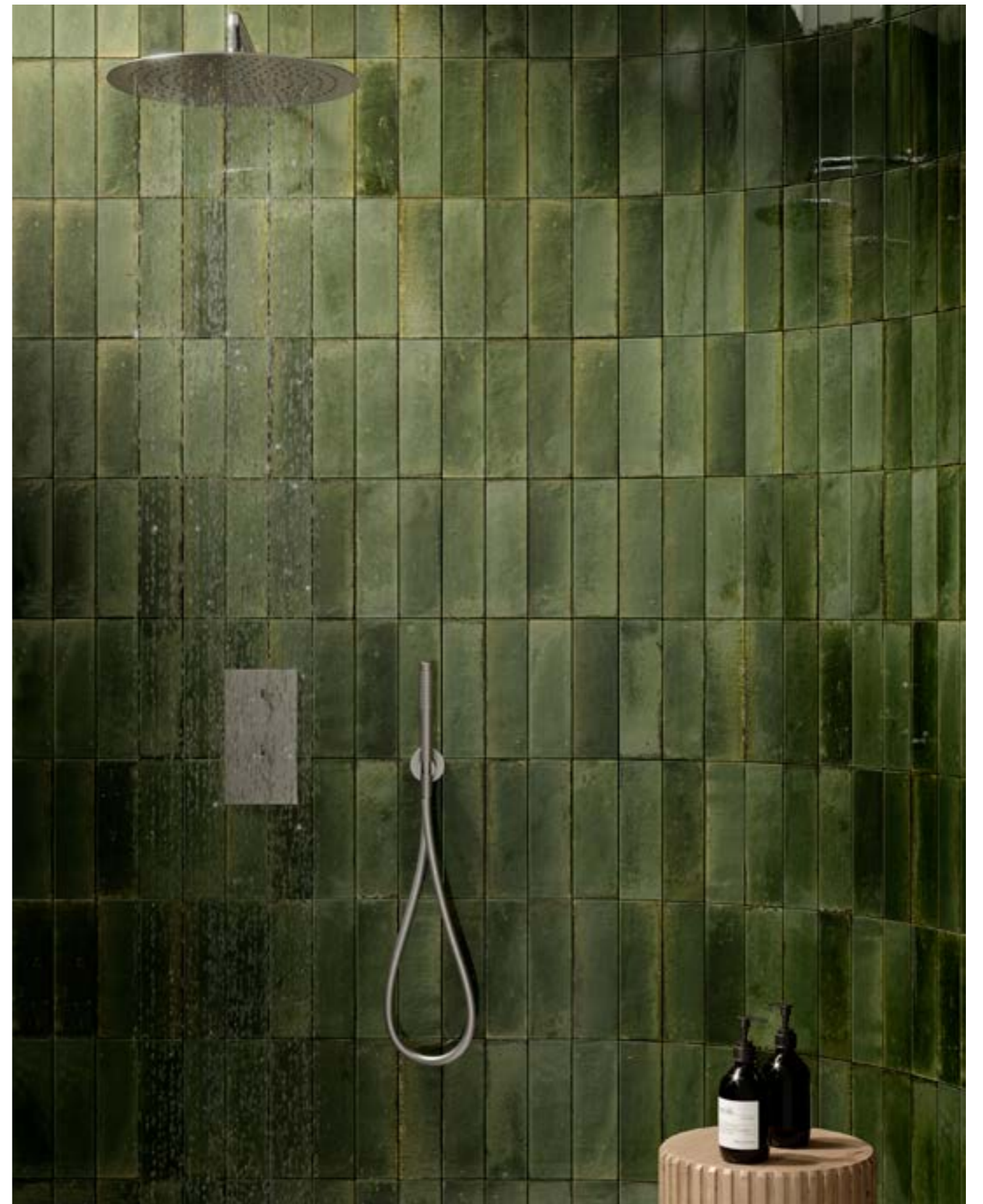
R8FS Look Oliva 6x24 - 2 3 / 8 "x9 7 / 16 "