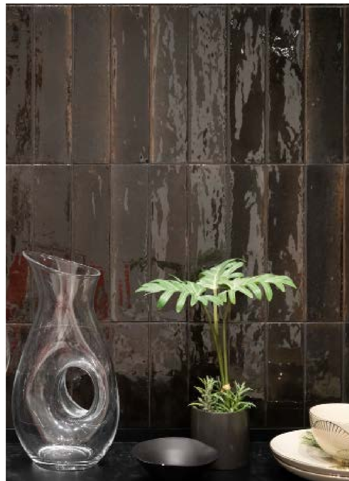
R8FN Look Nero 6x24 - 2 3/8 "x9 7/16 "