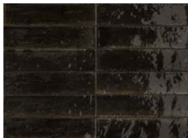
R8FN 6x24 Nero