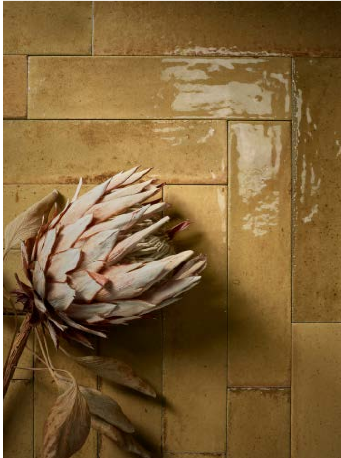
R8FT Look Ocra 6x24 - 2 3/8 " x 9 7/16 "