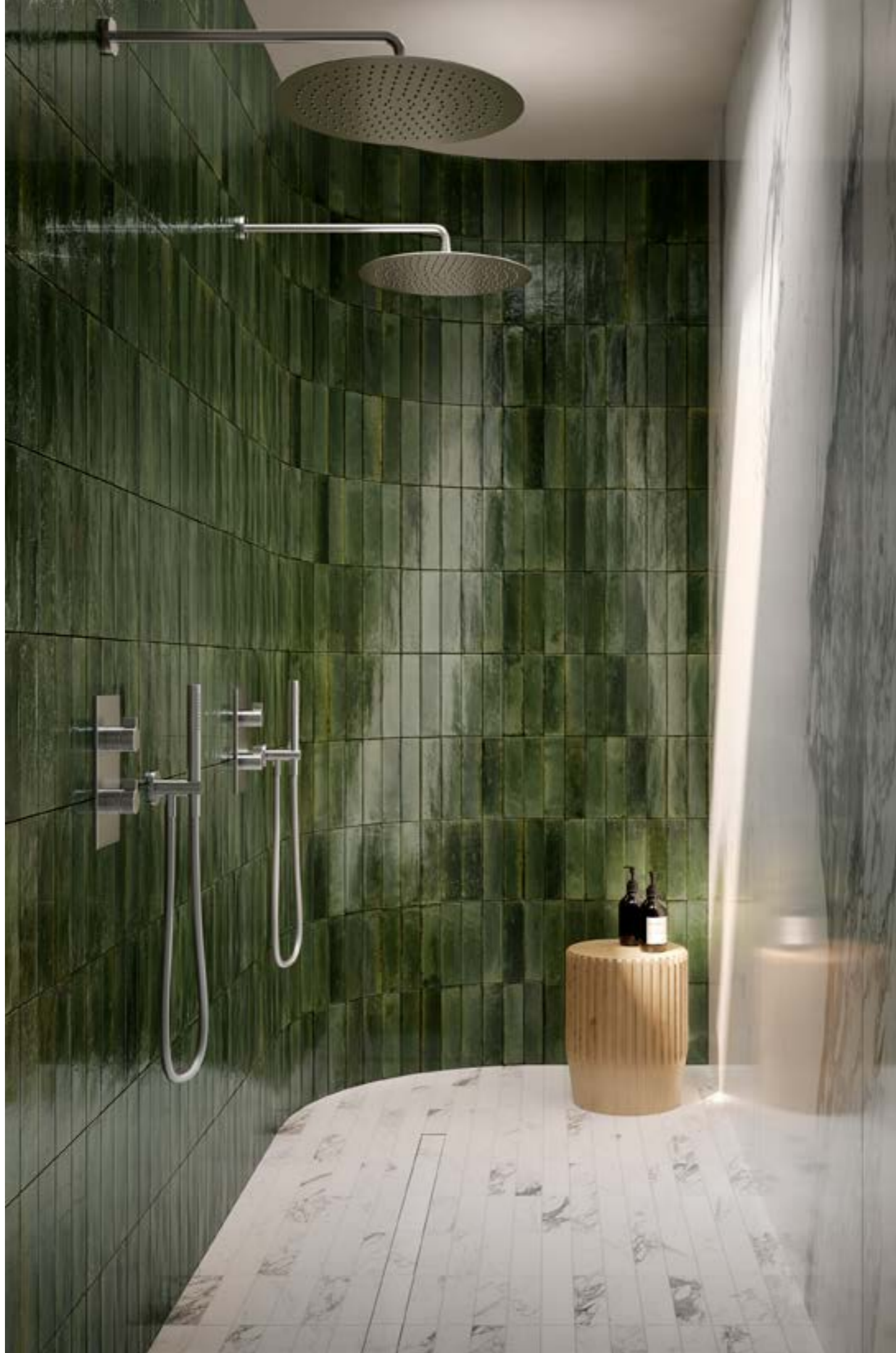
R8FS Look Oliva 6x24 - 2 3 / 8 "x9 7 / 16 " - R8TA Incanto Paonazzetto Glossy Rettificato 120x278 - 47 1 / 4 "x109 7 / 16 " - Incanto Paonazzetto Custom Mosaic 6x24 - 2 3 / 8 "x9 7 / 16 "