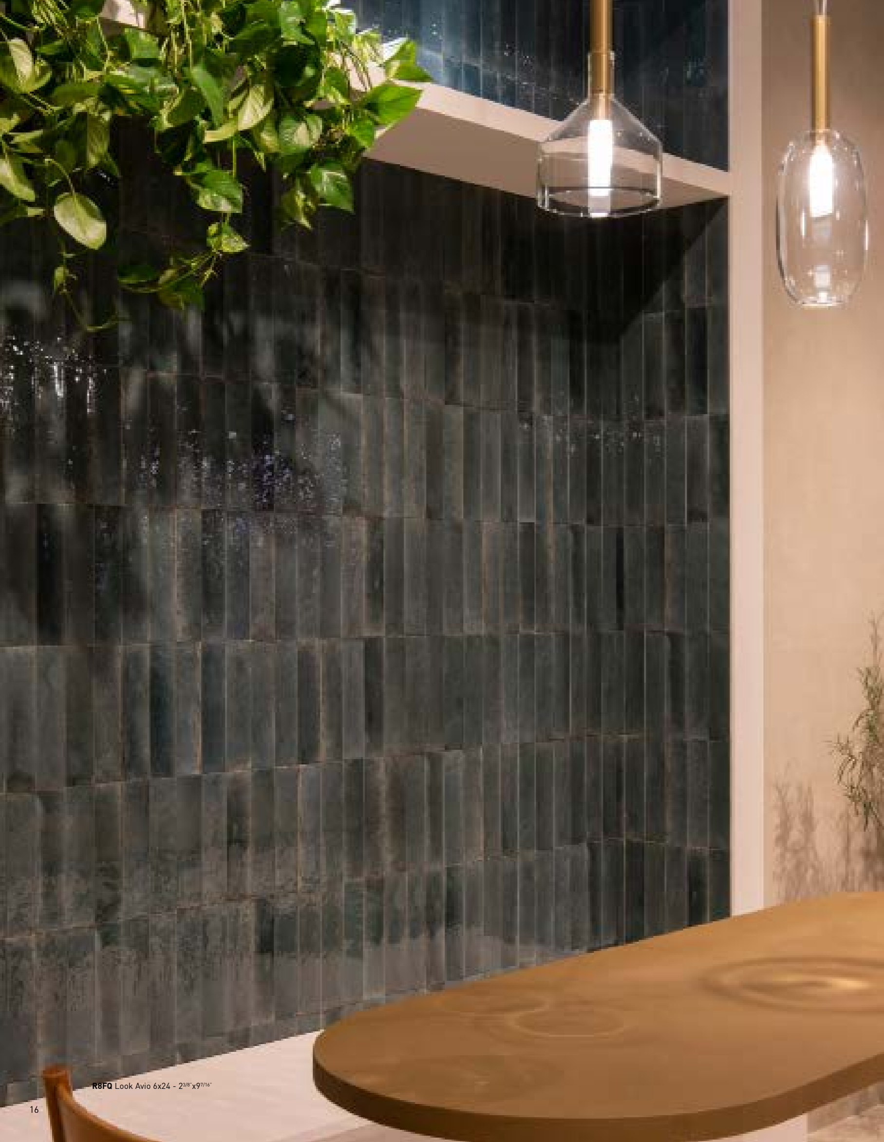
R8FQ Look Avio 6x24 - 2 3/8 "x9 7/16 "