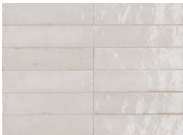
R8FM 6x24 Bianco