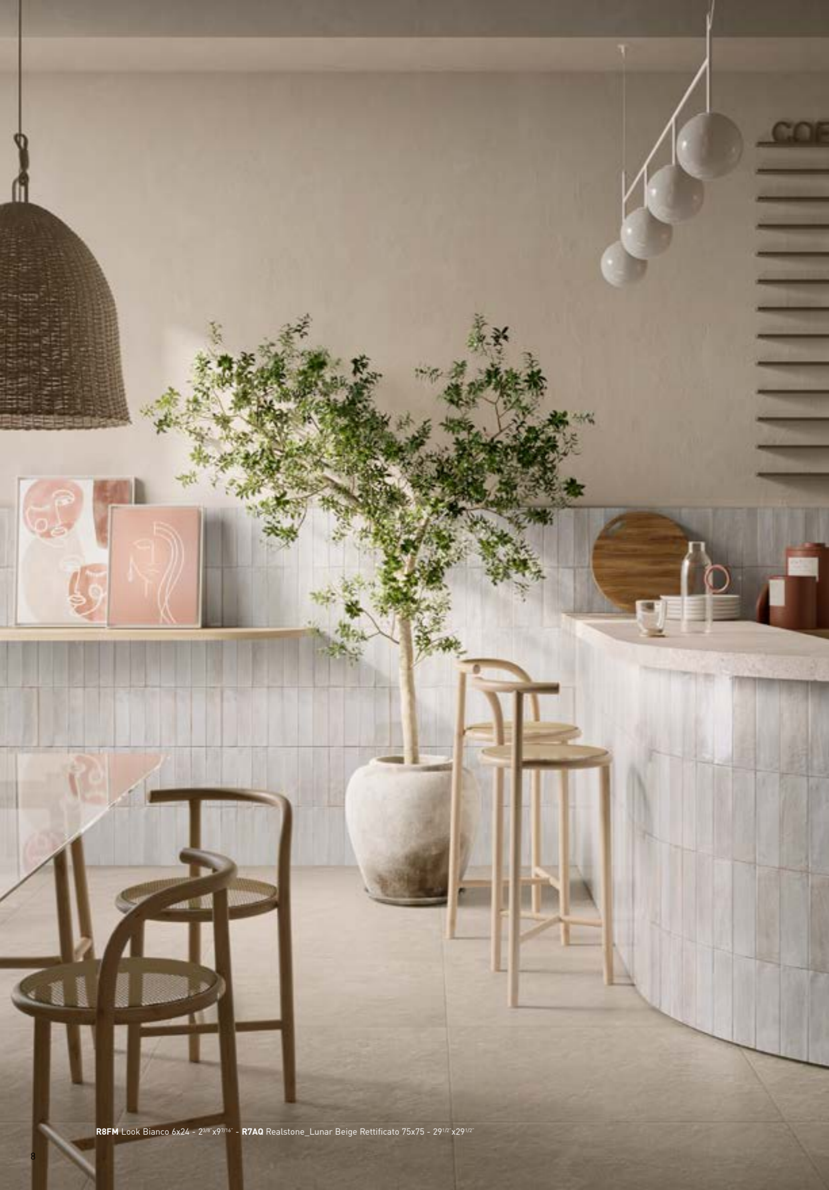
R8FM Look Bianco 6x24 - 2 3/8 x 9 7/16 - R7AQ Realstone_Lunar Beige Rettificato 75x75 - 29 1/2 x 29 1/2