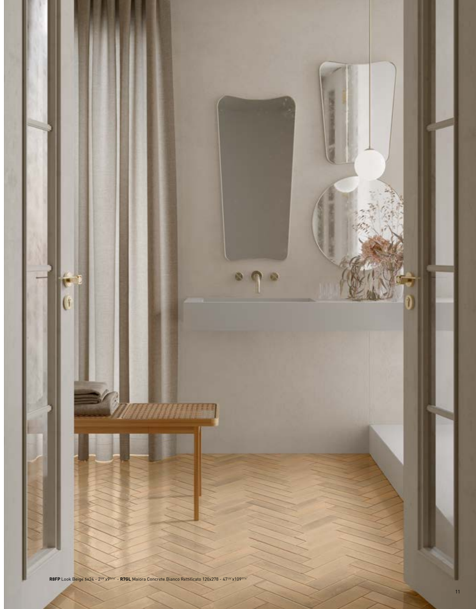
R8FP Look Beige 6x24 - 2 3/8 " x 9 7/16 " - R7GL Maiora Concrete Bianco Rettificato 120x278 - 47 1/4 " x 109 7/16 "