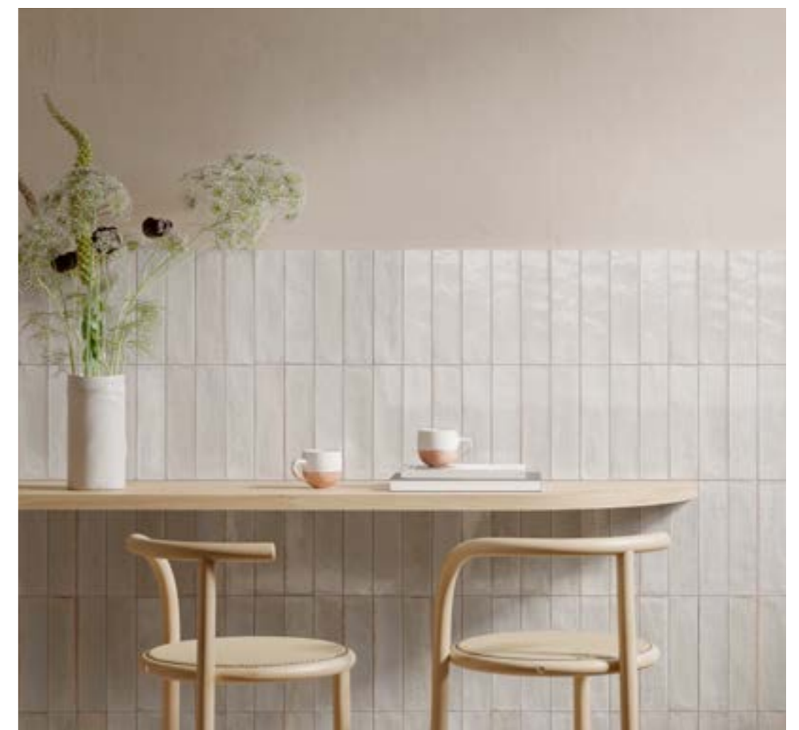
R8FM Look Bianco 6x24 - 2 3/8 x 9 7/16

multiple shade variations light up the walls / Unzählige Nuancen bringen Wände zum Leuchten / de multiples nuances éclairent les murs / múltiples matices iluminan las paredes / многочисленные оттенки оживляют стены