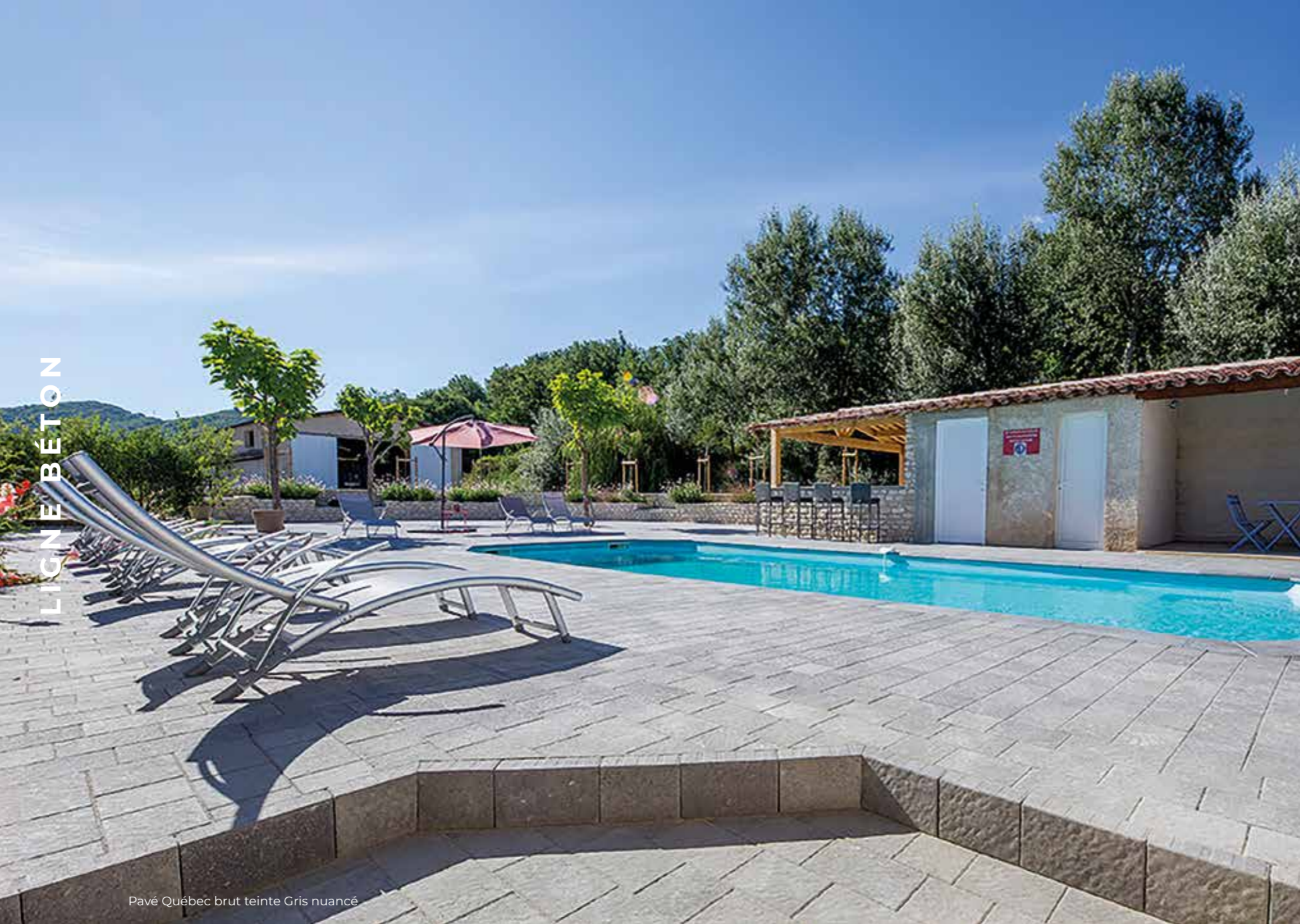
Pavé Québec brut teinte Gris nuancé