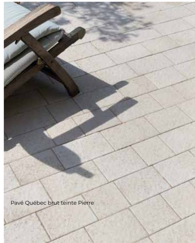
Pavé Québec brut teinte Pierre

Chaque pavé est équipé de distanceurs intégrés pour faciliter l'espacement entre les joints.