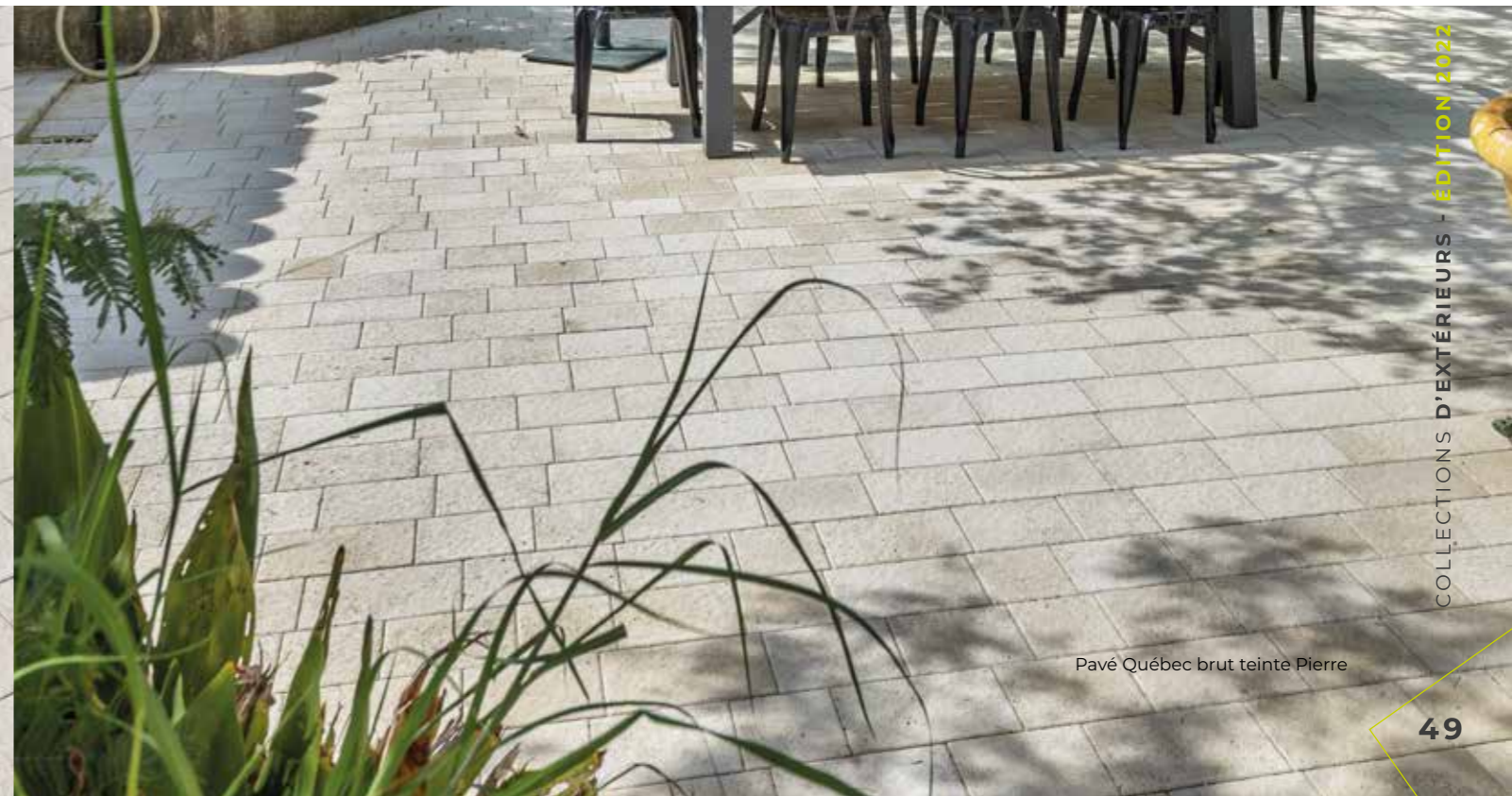
Pavé Québec brut teinte Pierre