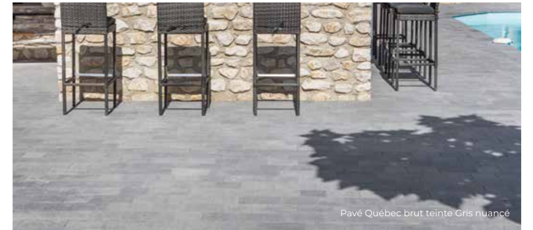
Pavé Québec brut teinte Gris nuancé

CALEPINAGE : des suggestions de poses sont disponibles sur le site www.fabemi.fr