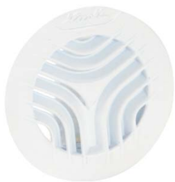
GATM100 GATM110 GATM125