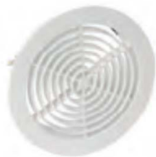
GATM80 GATM140 GATM160