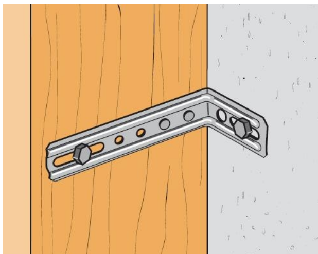
Mise en situation

ZAC des 4 chemins 85400 Sainte Gemme la Plaine France